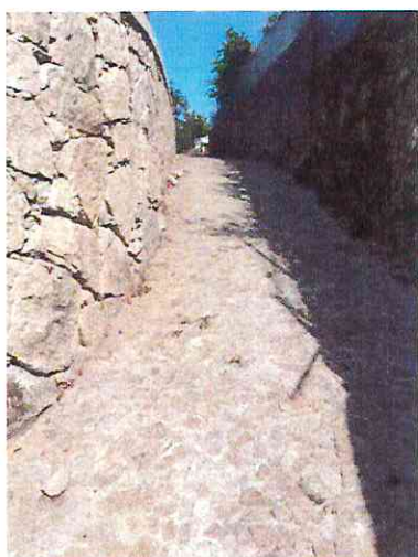
Pavimentação do caminho de ligação da Fonte das Mamas à Fonte das Brechas

Repavimentação de caminho no Esqueiro – Outeiro